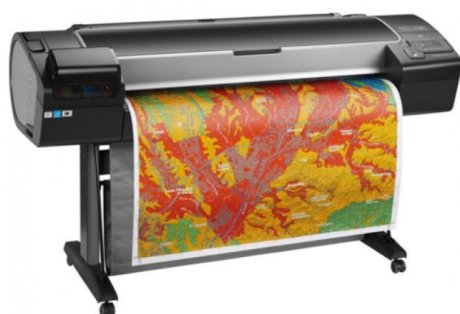
Tireuse de plan Roland 900