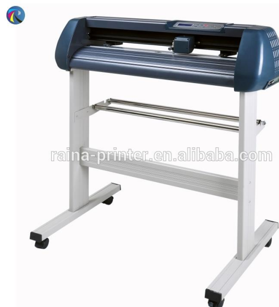
Découpeuse vinyle 850