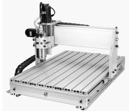
Fraiseuse numérique 3 axes 500 X 700 X 150