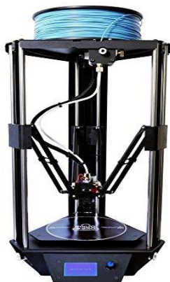
Emotion Delta 260 x 300