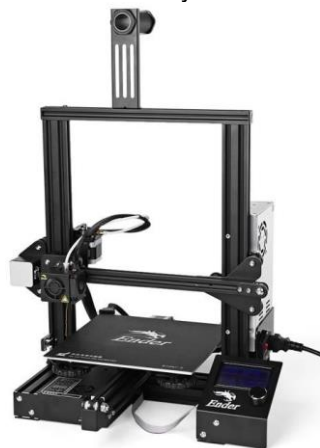
Imprimante 3D Pcecreality 500 x 500 x 500