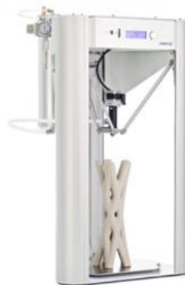
Imprimante 3D céramique dia 200 x 400