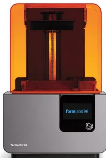
Imprimante 3D Stéréo lithographie