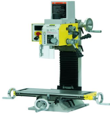
Fraiseuse mécanique 500 x 450